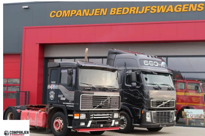
Volvo F 16.485 F16