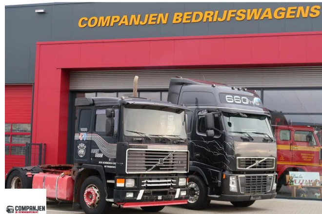
Volvo F 16.485 F16 - 485 - 1989 - Oldtimer