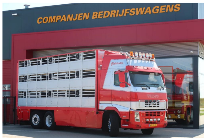
Volvo FH 12.460 FH 12-460 OLD TACHO www.companjen.nl