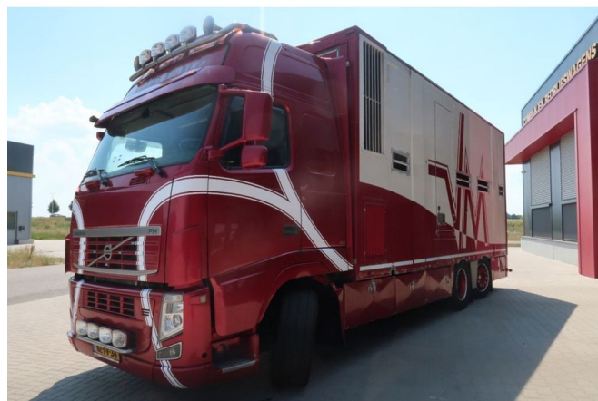
Volvo FH 13.500 fh 500 EEV