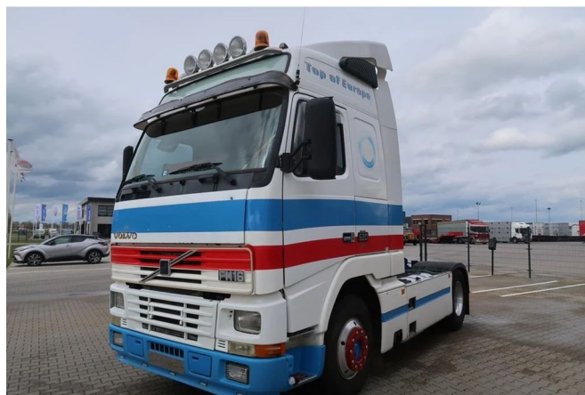
Volvo FH 16.520 FH 16