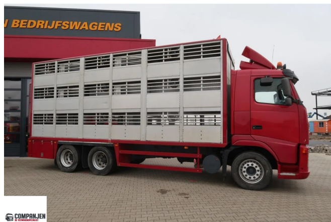
Volvo FH 380