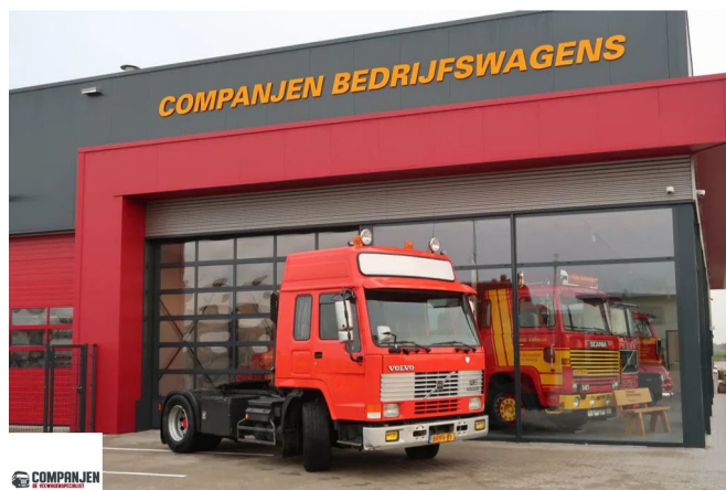
Volvo FL 7.260 FL7.260 42T - 1997 - Globetrotter rooftop