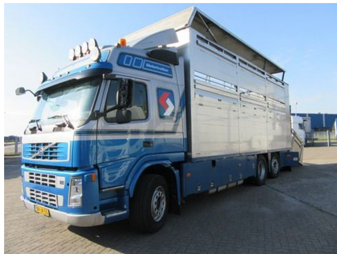
Volvo FM 9