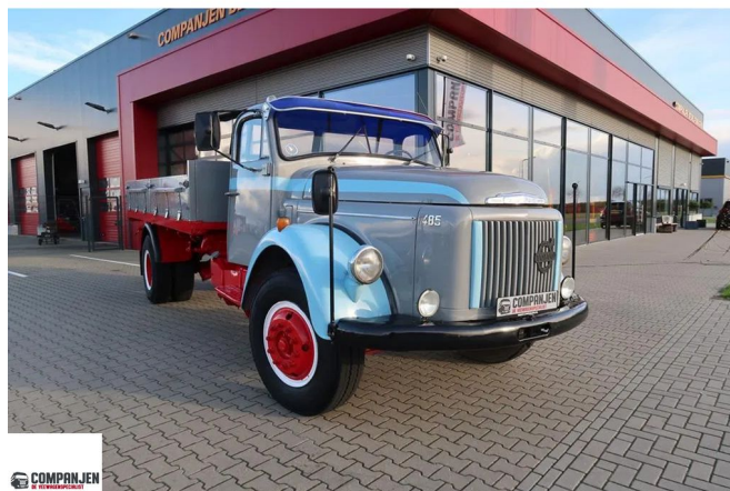
Volvo L L 485 - 1963 - Oldtimer