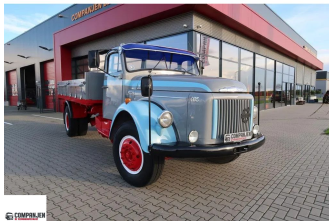
Volvo L L 485