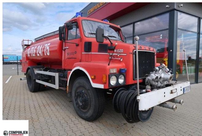
Volvo N 10 N10 4x2 - 1978 - Good condition - Oldtimer