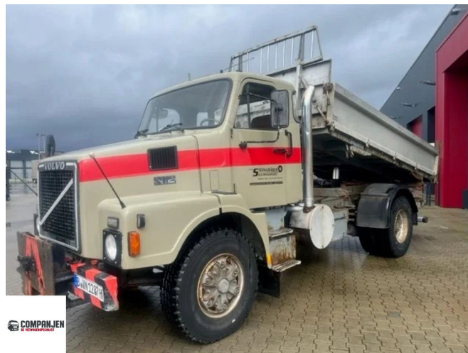
Volvo N 12 N12 - 1987 - Tipper - Oldtimer