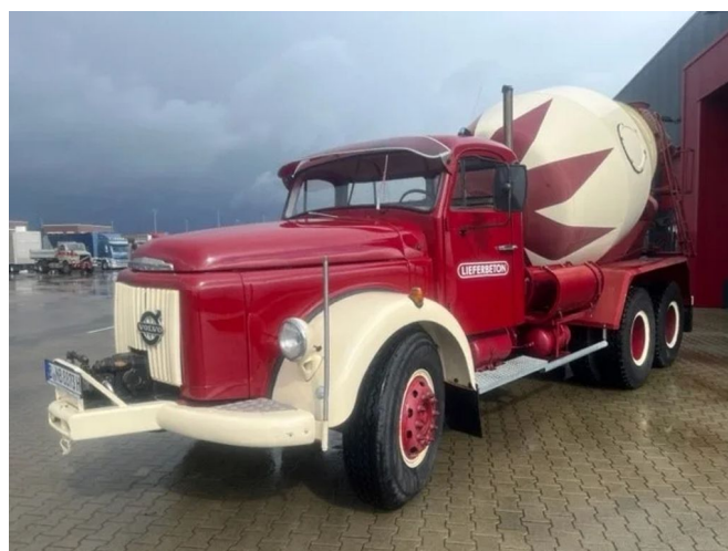
Volvo N N88