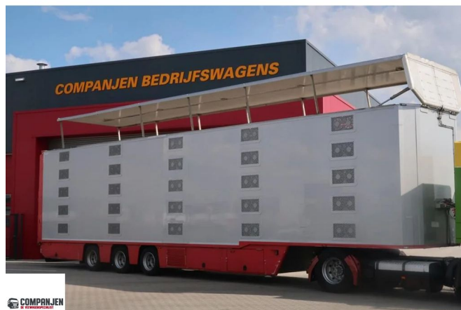
CUPPERS LVO 12-27 AL - 2014 - 5 LEVELS - Folding floors