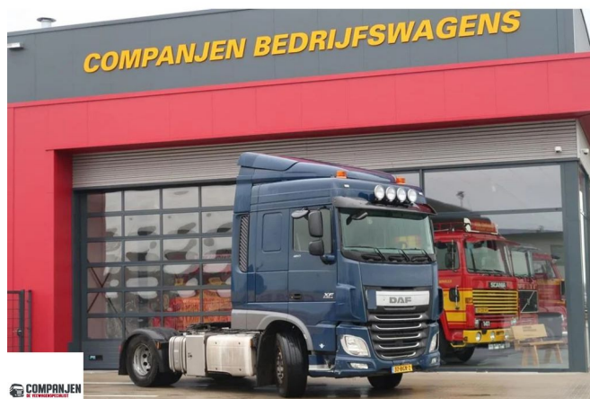
DAF XF 460 HAEN3 - 2016 - Euro 6 - Walking floor + tipper hydraulic 4x2