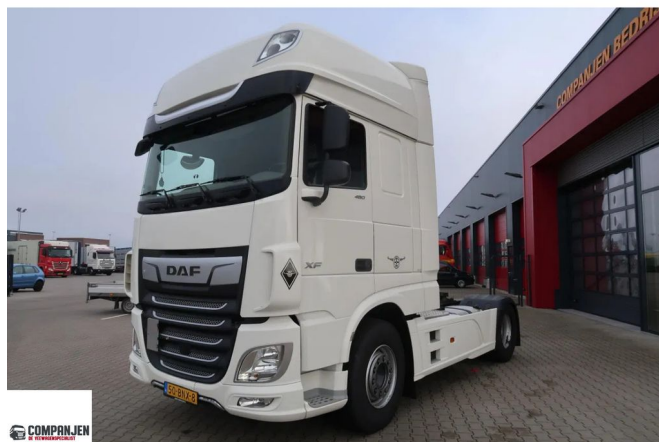
DAF XF 480 XF Super space cab