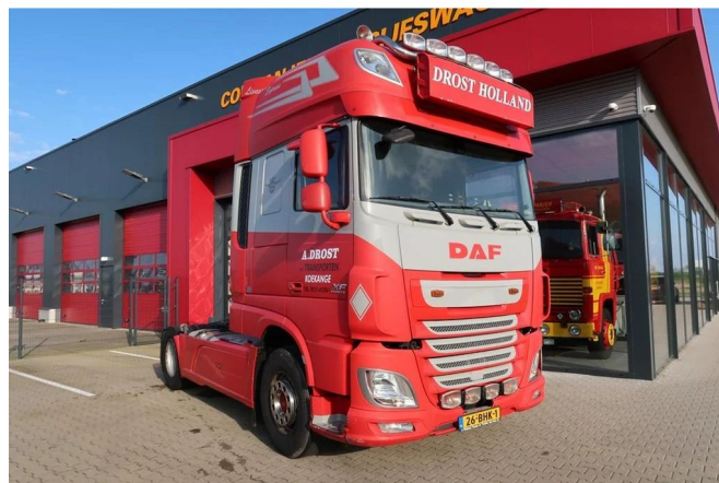
DAF XF 510 XF 510