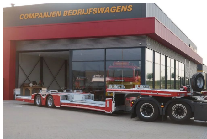
Diversen Eroglu TRR-TC-02