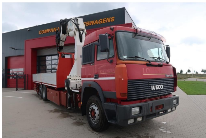
Iveco Turbostar 190.36 190-36