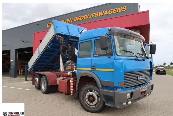
Iveco Turbostar 190.42 Turbostar 190.42 - Tipper with crane - Bonfiglioli... 6x2