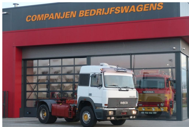
Iveco Turbostar 190.42 V8 190.42