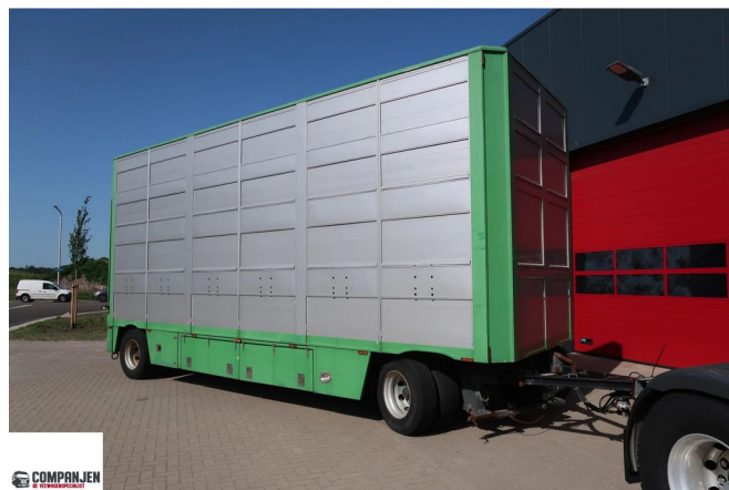
Jumbo MV 200