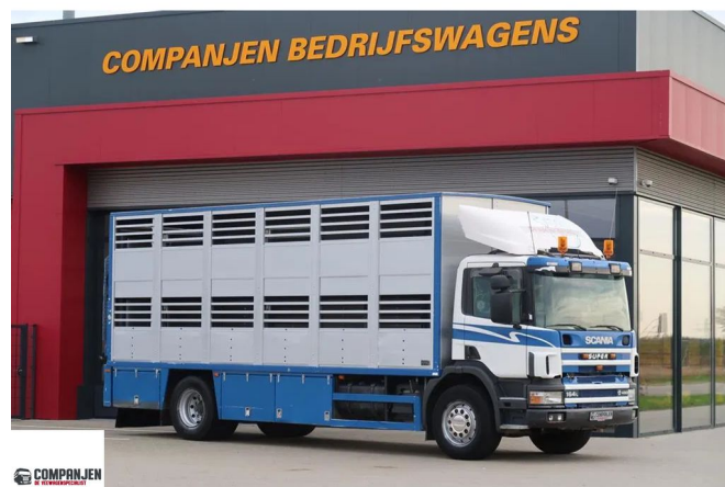
Scania P94-260 P94 - 260, 1998 - Cattle and pigs transport