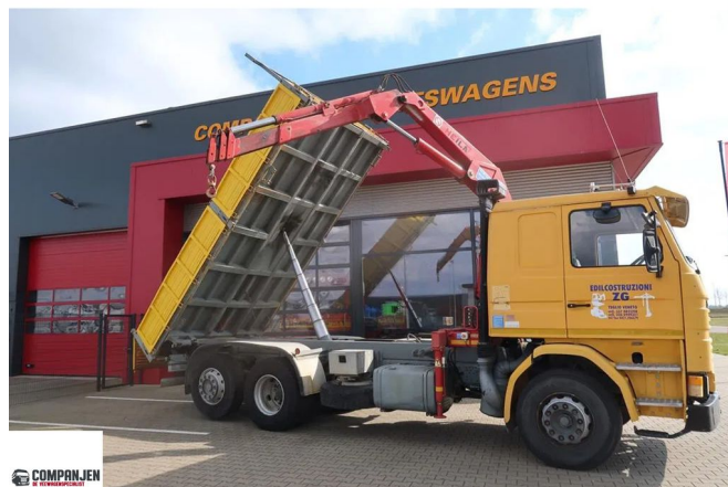
Scania R142-V8 R142 6x2 -3 side Tipper- Heila Crane type HL7500 serie...