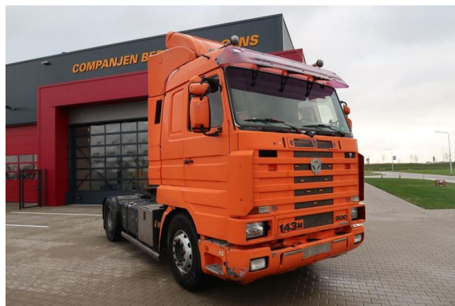
Scania R143-500 V8 143-500 Streamline