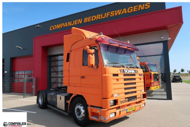
Scania R143-500 V8 met nieuwe APK - with new MOT - Mit neuem TuV 4x2

• ABS • Aire acondicionado • Bocina de aire • Cabina de dormir • Caja de herramientas • Cruise control • Doble Tanke de combustible • Limitador de velocidad • Luces de niebla • Parasol • Radio / reproductor de CD • Spoiler para el techo