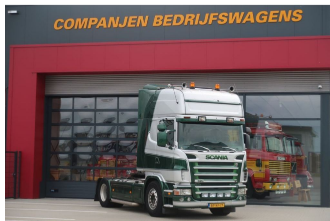
Scania R164-480 V8 164 480 Original Dutch Truck KING OF THE ROAD 4x2