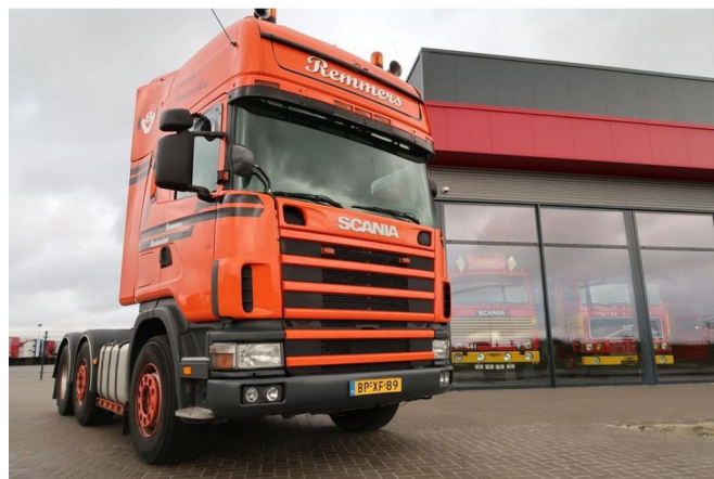
Scania R164-580 V8 R 164 GA 6x2 ...