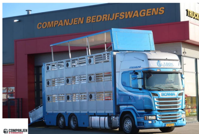
Scania R450 R450 - Retarder - Pig transporter