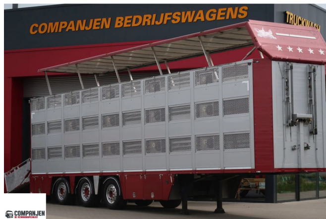
Van Hool Bekkers Type 1 92.10 m2