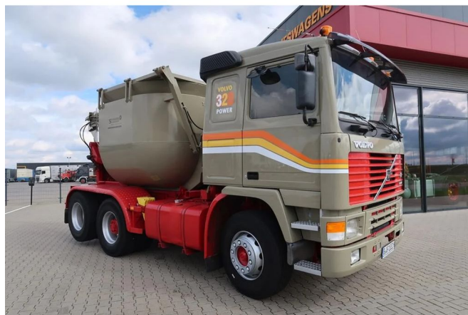
Volvo F 10.320 F10