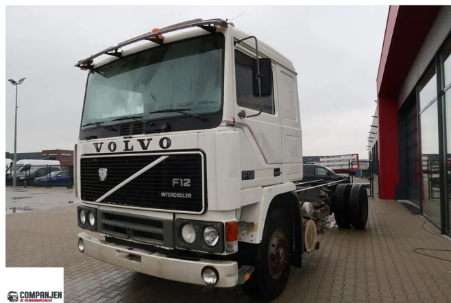
Volvo F 12.360 F 12 - 360, 1984 - Oldtimer Chassis Cabine