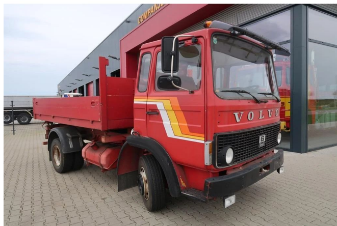
Volvo F 6 F 609