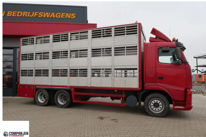
Volvo FH 380