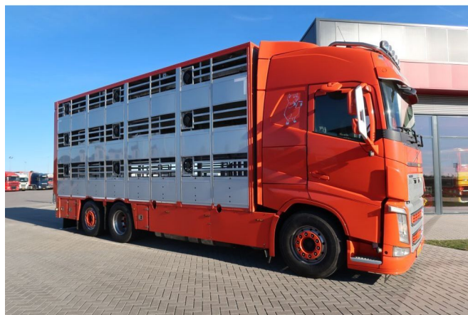
Volvo FH FH 460