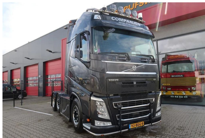
Volvo FH FH 540