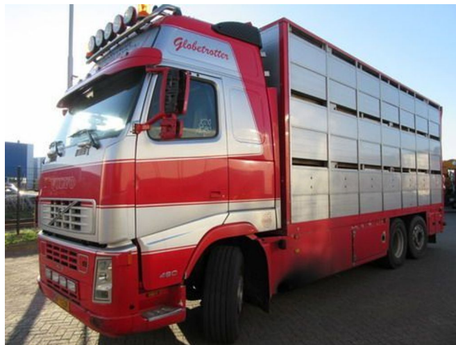
Volvo FH12 6X2R FAL8.0 RADT-A8 HIGH