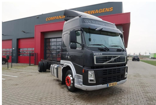
Volvo FM 300 FM 9