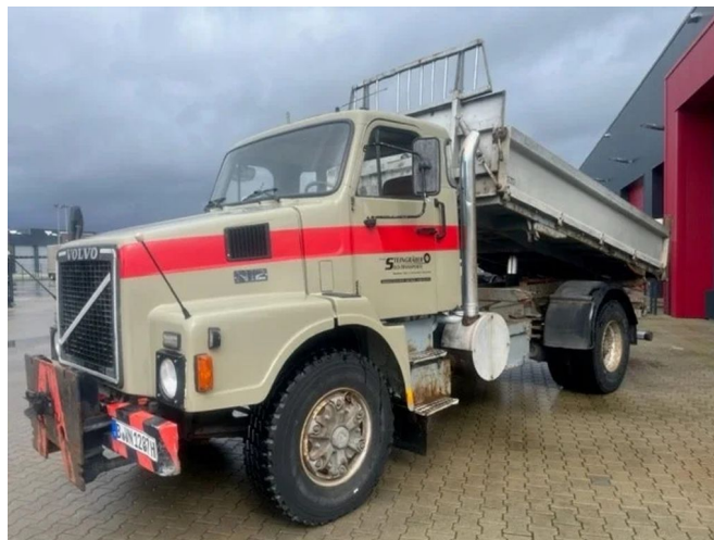
Volvo N 12 N12