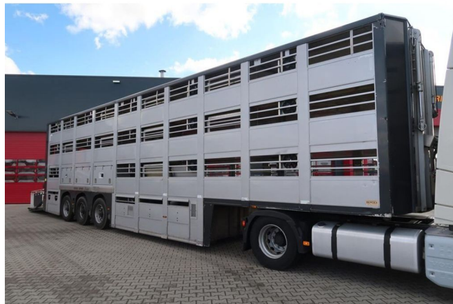
Berdex XXXL LINER