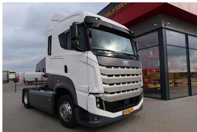
BMC Elegance Tugra TGR 1846