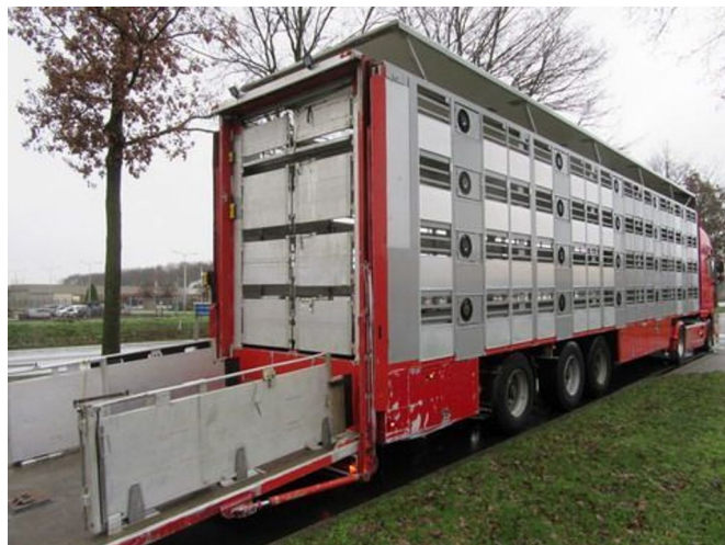
CUPPERS LVO 12-27 ASL