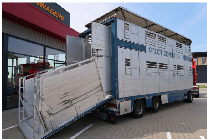
CUPPERS VA.1018 www.companjen.nl