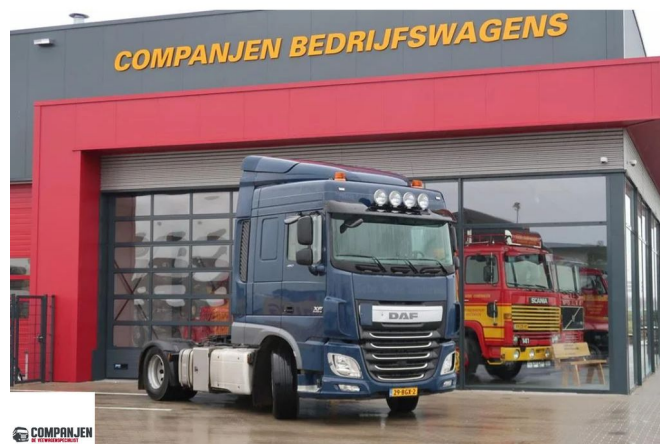
DAF XF 460 H4ENB - 2016 - Euro 6 - Walking floor + tipper hydraulic 4x2