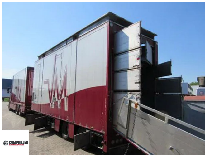
GS Meppel AV 2800 A - 2005 - Geconditioneerd transport