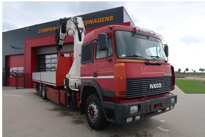
Iveco Turbostar 190.36 190-36