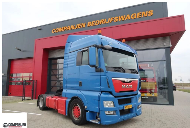
MAN TGX L 2007.46.001 - 2016 - Euro 6