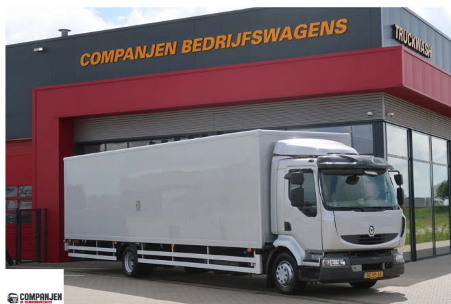
Renault Midlum Hogedruk Reinigingstruck Cleaning truck 5x Yanmar ... 4x2 Referentienummer: BZVP38