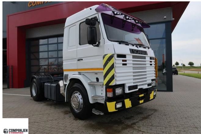
Scania R143-450 V8 143-450 Topline - 1989 - Retarder