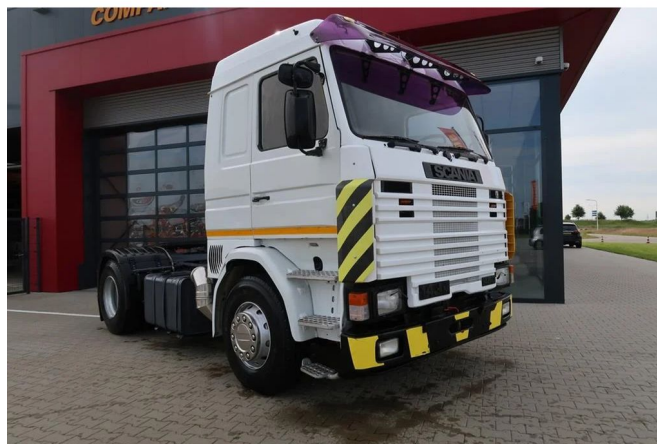
Scania R143-450 V8 143-450 Topline